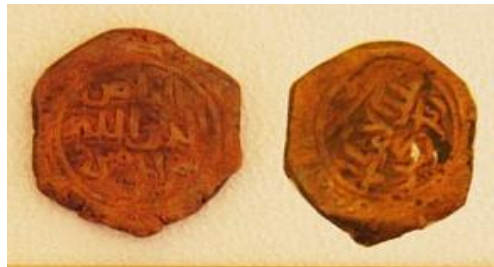
Şəkil 6. Azərbaycan atabəyləri (1136 - 1210). Bilon dirhəm (xəlifə ən-Nasirin adı ilə).

Azərbaycan atabəyləri (1136 - 1210) dövrünün bilon dirhəmi orta əsrlərin “müsəlman intibahı” adlandırılan mərhələsinin bariz nümunəsidir. Məhz bu dövrdə sikkəyə yaranan tələbatla əlaqədar Azərbaycanda mis sikkə zərbi geniş vüsət almışdı [1, s.4; şəkil 6].