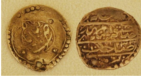
Şəkil 8. Qarabağ xanlığı. Pənahabad, hicri 1233 = 1817-1818, gümüş pənahabadi.