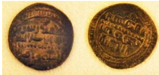
Şəkil 5. Şəddadilər (985 - 1118). I Fəzl ibn Muhəmməd (995 - 1010), gümüş dirhəm.

Şəddadilər dövrünüə aid numizmatik tapıntılar nadir materiallardır. Bu dövrdə əsasən Bərdə və Gəncədə gümüş dirhəm zərbi həyata keçirilmişdir [şəkil 5].