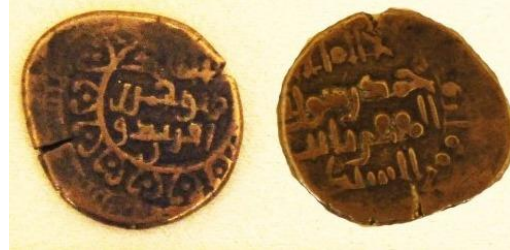
Şəkil 4. Şirvanşah-Kəsranilər (941–1382). Mənuçehr II bin Əfridun (hicri 514 – 555 = 1120 - 1160), bilon dirhəm.

Şəddadilər dövrünüə aid numizmatik tapıntılar nadir materiallardır. Bu dövrdə əsasən Bərdə və Gəncədə gümüş dirhəm zərbi həyata keçirilmişdir [şəkil 5].