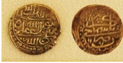
Şəkil 7. Şamaxı xanlığı, hicri 1173 = 1759-1760, gümüş abbası