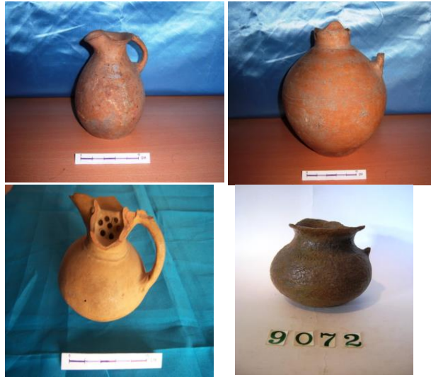
Şəkil 1. Lələli-Torpaqqala yaşayış məskənində aşkarlanan saxsı məişət qabları.

Məqalədə ilk dəfə olaraq Qanıxçay (Alazan) arxeoloji mədəniyyətinin təmsil edən tapıntılar (saxsı qablar, sikkələr) barədə məlumat verilib. Belə tapıntılar hazırda Qax rayonundakı Tarix-diyarşünaslıq muzeyində qorunur [şəkil 1 və 2].