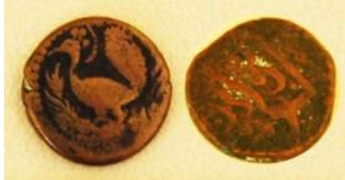
Şəkil 9. İrəvan xanlığı, mis fəls (qazbəyi), XIX əsr

Numizmatik tədqiqatlara əsasən bu dövrə aid qızıl sikkələr məlum deyildir. Gümüş və mis sikkələrdə xanların adları zərb edilməsə də zərb ili və zərbcana haqq edilib [2, s.251, 256, 262].